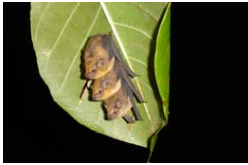
Süsse kleine Fledermausbaby's

leise und langsam geht, angefangen von den jungen Fledermausbaby's