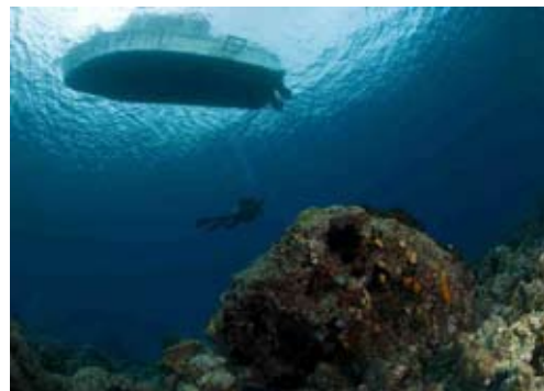
Sicht in die Banda Sea

ist fangfrischer Fisch einer der Hauptbestandteile, aber auch Vegetarier kommen hier voll auf ihre Kosten. Geniessen sie Gerichte wie „Sambal Goreng Tempe“, süss durch Palmzucker und schmackhaft durch Chilis oder „Gado-Gado“, gekochter Gemüsesalat mit Erdnussauce, schmackhaft und nährstoffreich ist. „Ikan Bakar Colo-Colo“, Fisch im Bananenblatt gegrillt mit dem Colo-Colo Sambal welches ihm den typischen Geschmack