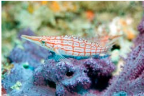
Langnasen Büschelbarsch

Aneinigender Tauchplätze der Inseln Molana und Nusa Laut gibt es an der