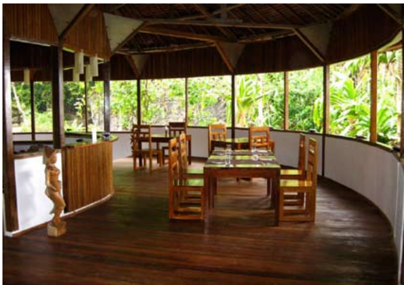
Restaurant "Mata Hari"

Bereits sind die ersten vier Monate dieses Jahres Geschichte. Der Frühling hat Einzug gehalten, Sonnenlicht bescheint das zartgrüne Frischlaub der Bäume, zahllose Blümchen strahlen um die Wette und intensivieren die Wärme. Anders bei uns, wie Ihr alle wisst, gibt es hier eine sogenannte „wet-monsoon season“ ( Junli bis August) und eine „dry-monsoon season“, September bis Juni. Die bedeutet, dass die Sonne lacht und die Temperaturen schnell über die 30 Grad steigen und es noch