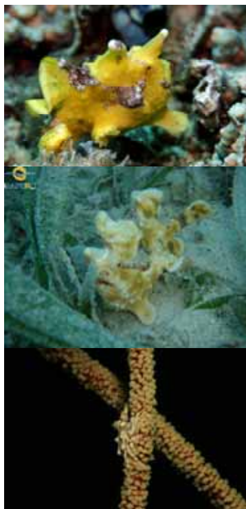
Froggisch und Mickeymousekrabbe