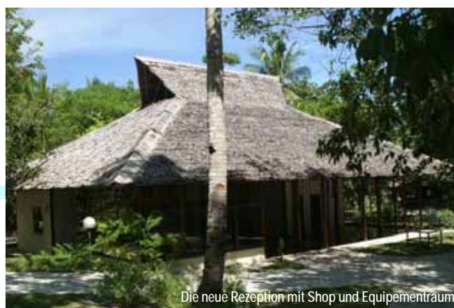
Die neue Rezeption mit Shop und Equipementraum

Wir benützen die kommende „Regenzeit“, in der wir das Resort für Gäste geschlossen haben, um einige Renovationen