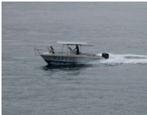
Angin Putih

„Angin Putih“ wurde runderneuert und sieht besser aus als Neu. Die Maschinen sind ueberholt und