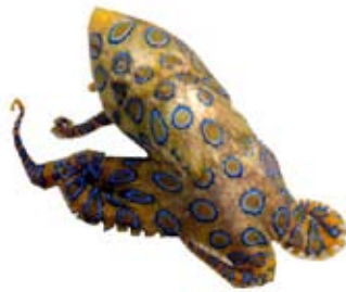
Bluring Octopus

gehören. Sie haben einen rundlichen Körper, acht kurze Arme und ein Paar einziehbare Tentakel. Beiderseits des Körpers sitzt eine abgerundete Flosse. Tagsüber verstecken sie sich meist in weichem Sediment und kommen nachts