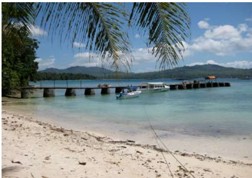
Der neue Pier

Beim Restaurant Mata Hari wurde die Terrasse überdacht