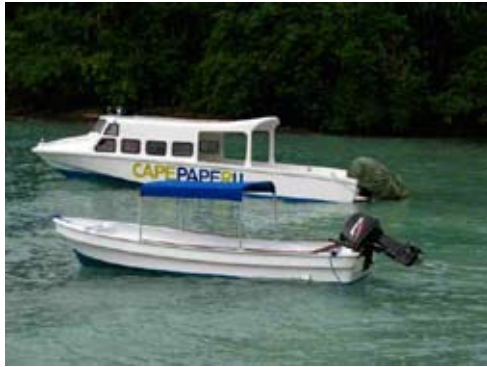
„Bintang Pagi“ und „Mutiara“

flüsterleise Suzuki Viertaktmotoren bekommen die das Boot wenn es