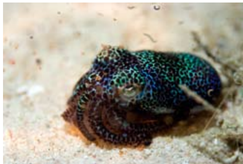
Stummelschwanz Sepia

wurde vergrößert und bietet nun mehr Platz für Equipment, Sitz- und Aufenthaltsgelgenheit für die Taucher. Bereits steht auch die dritte „Bale“ am Strand, und die Sonnenliegen