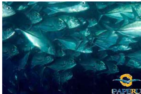
Stachelmakrelen ohne Ende

Fällt Dir/Euch die Decke zu Hause auf den Kopf oder seid ihr ganz einfach nur „Ferienreif“, dann profitiert von unserem Spezial- Angebot für