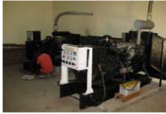
Strom 24 Std, am Ende der Welt

in Flaschen oder Gallone sind im Zimmerpreis enthalten und es besteht die Möglichkeit von Kaffee oder Teezubereitung.