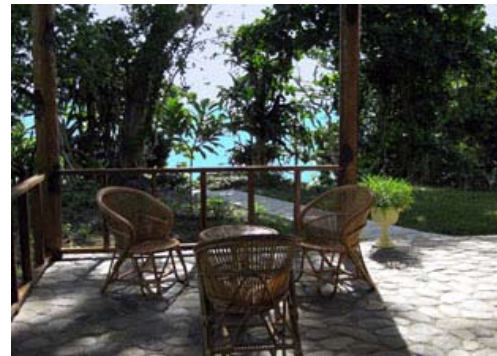
Terrasse Bungalow "Bunga Kambodscha"

Von der Terrasse aus kann man die herrliche Aussicht über die Bandasee und die vorgelagerte Insel «Nusa Laut» geniessen, wenn man etwas