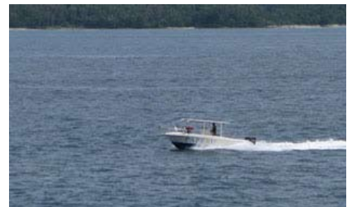
Angin Putih in voller Fahrt

Arbeit als Tauchschiiff hervorragend. In der Zwischenzeit hat unser „Bootsbauer Daniel“ und sein Team mit dem Umbau des Bootes „Bintang Bagi“ begonnen. Die neuen Bootsmotoren sind geliefert worden und warten auf ihren Einbau. In etwa 2 Wochen wird es als Transfer- und Tauchschiiff für 10 Taucher einsatzfähig sein.