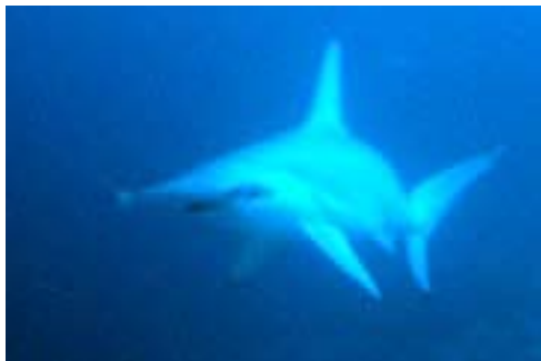
Taucher Highlight Hammerhai

Molana und Nusa Laut gibt es an der Rifffkante spektakuläre Steilwände üppig geschmückt mit Horn- und Weichkorallen, Gorgonien, Wäldern von Peitschenkorallen und zarten Feuerkorallen, dazu sehr grosse Schwämme.