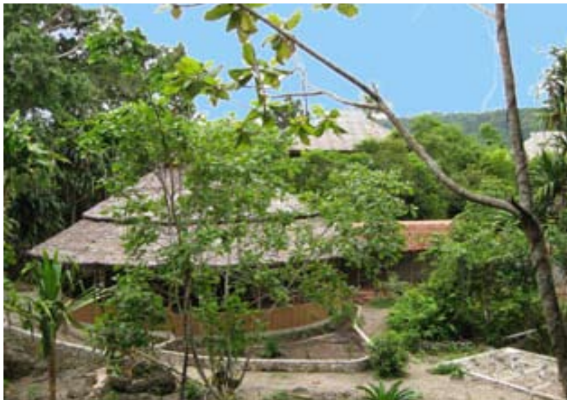
Restaurant "Mata Hari"

Langsam neigt sich das Jahr 2008 dem Ende entgegen. An dieser Stelle bedanken wir uns herzlich bei unseren Freunden, welche in guten und in schlechten Zeiten zu uns halten, bei unseren Familien, den Reiseveranstaltern welche mit uns zusammenarbeiten und vor allem